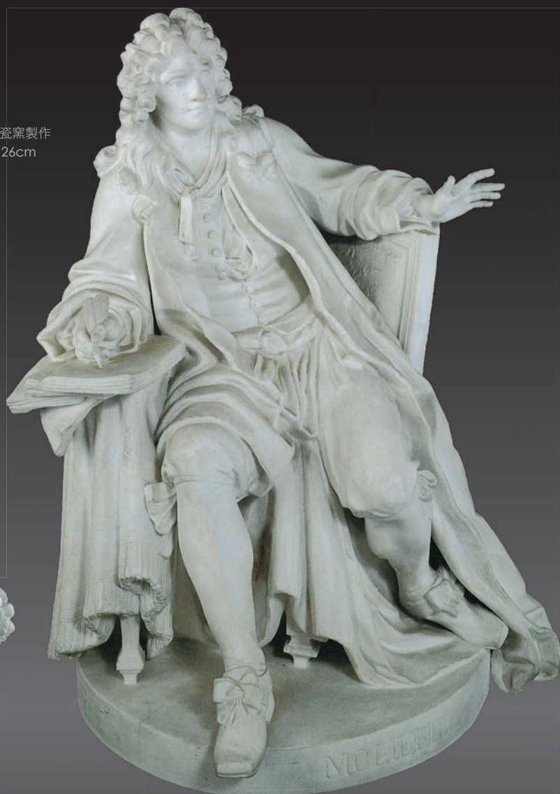
莫里哀瓷像 塞弗爾瓷窯製作 19世紀 38.5×30×26cm 凡爾賽宮藏