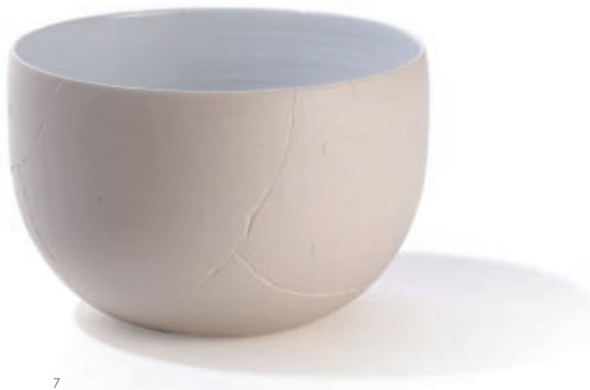
7 盧家恩設計、林國隆製作 「未來的痕跡」碗組

然而，我們必須了解的是，西方的器物文明發展，以及設計與製造系統之主宰優勢的產生，並非單純只依靠政治及經濟的強勢，反而是有著一脈傳承的綿密發展，以及堅實的理論基礎與實踐整合密度。西方器物史自近代以來的歷程，不僅是一部紮實的技術發展與應用史，更是一連串因技術催生各種人文思惟的精采辯證實績紀錄，亦是人類創造力極致發揮的明證。