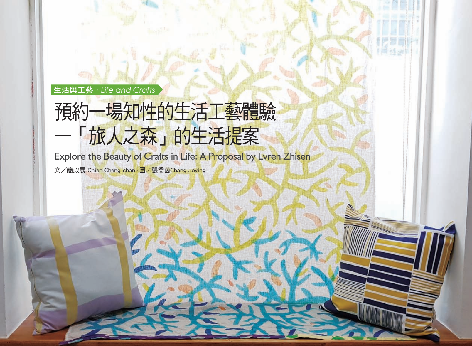
旅人之森的空間裡，利用編織染布裝飾而成的窗簾一景。

文／簡政展 Chien Cheng-chan · 圖／張喬茵 Chang Joying