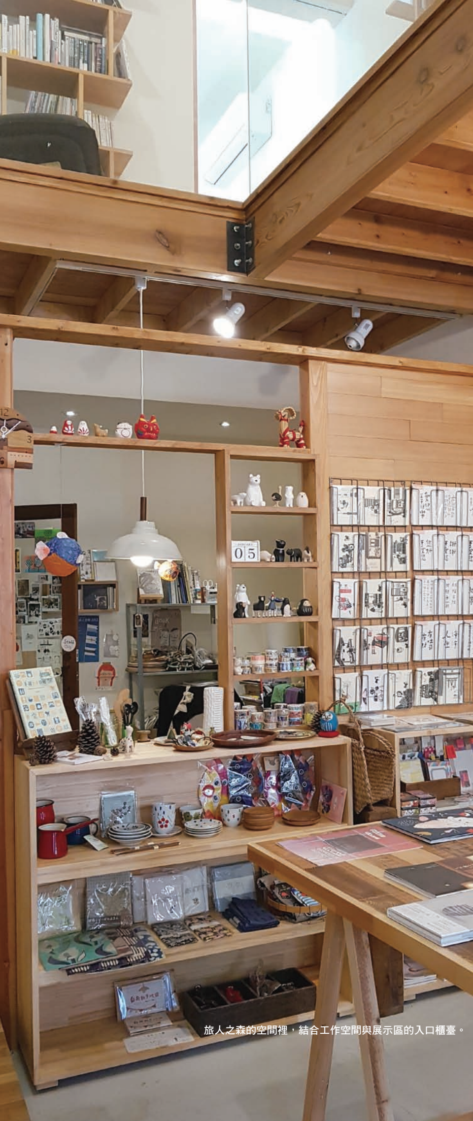
旅人之森的空間裡，結合工作空間與展示區的入口櫃臺。