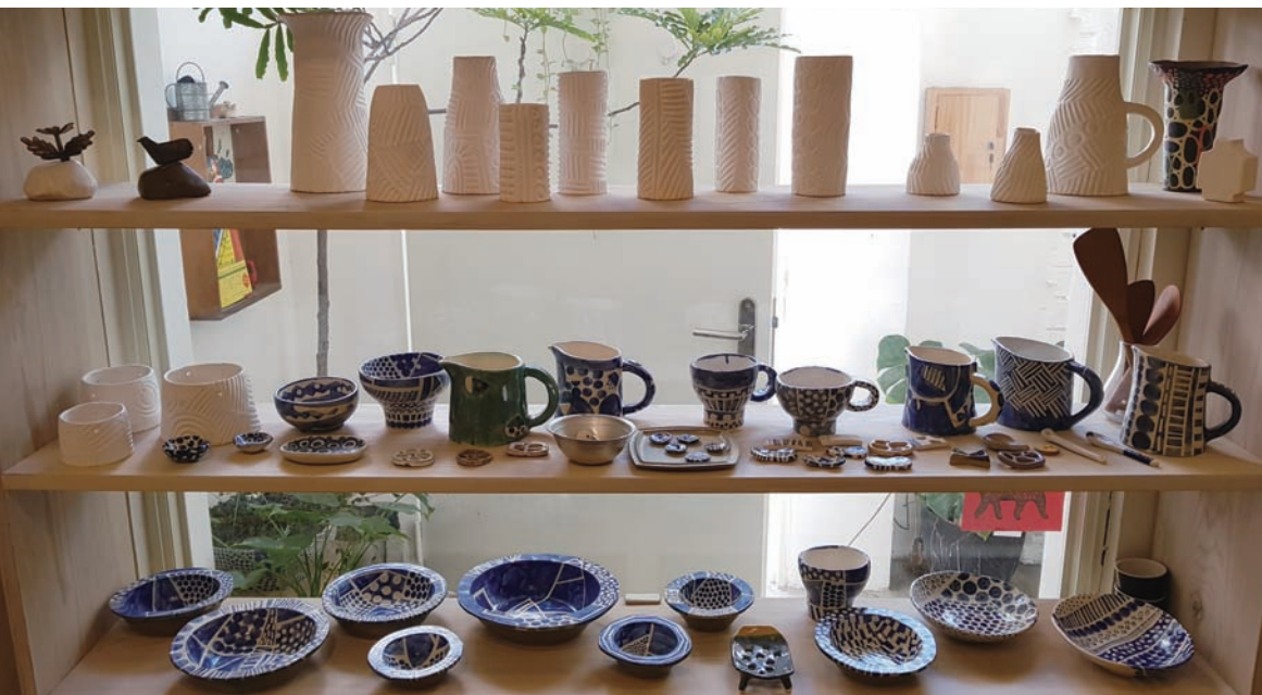
旅人之森的生活陶藝展示分享販售區

問，這件東西能買來做什麼用？但她希望透過這個環境的分享，讓每件工藝品除了原本定義的使用方式外，使用者也都能發揮自己的想像力，賦予這些工藝品更多的可能性。當初她與先生一同創立旅人之森，就是期待帶給每位旅客，不只有家的自在與舒適，更衍生出不同生活方式的視野與轉換。而體驗工藝的使用感受，就是創造這種生活經驗的最貼切方式。她將自己的創作、旅遊各地的收集，以及和友人合作下的創作提案實踐，融入到這間城市體驗空間中，把看似簡單的平凡物件，凝聚在生活視角當中，轉化為不一樣的使用體驗。