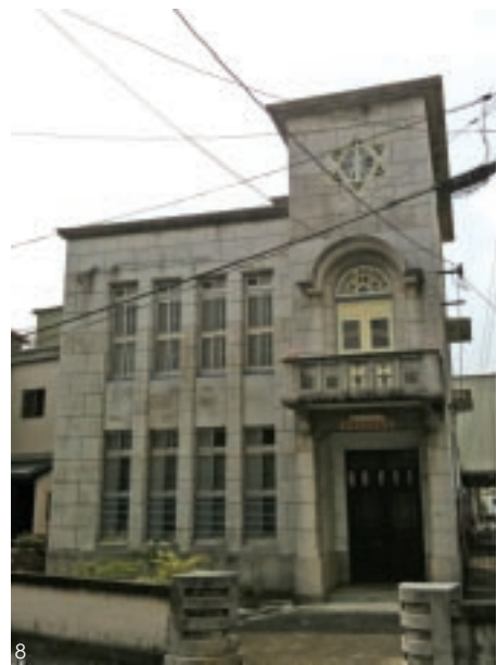
8 洋式風格楊友登醫院

因此，客家文化原本就已經存在於我們的生活之中，像是生活中不可或缺的飲食，如板條、炒大腸、高麗菜乾、蘿蔔乾、鳳梨醬、鹹菜乾、豬膽肝、福菜、破布子等等。從生活空間中的歷史建築，時間的累積，文化的傳承下，都是未來可能創造出文化的生命。所以，面對文化創意產業的目的，即在整合地方智慧與文化藝術生命力，將其應用於文化產業發展，以因應未來「全球地方化」（glocalization）之浪潮。🌱