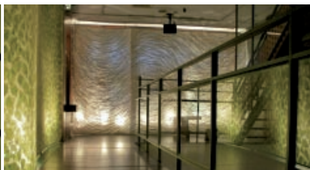
小林順子的〈森林的綠意〉及〈溪流〉