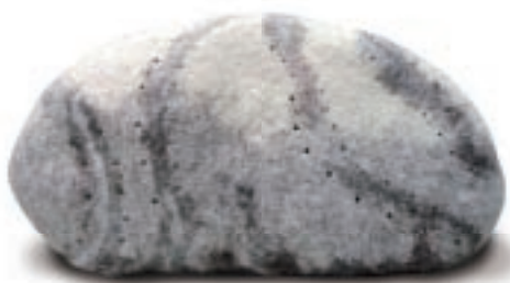
李豫芬 羊毛燈 羊毛

「工不可沒、藝不可失」為國立臺灣藝術大學（以下簡稱臺藝大）工藝設計系教授聯展，由王怡惠博士擔任策展人，展覽規劃串連材質創作、生活設計與跨領域文化創意三大層面。「工」是指有專門技術的人，追求手感與人性的表現；「藝」是工藝美學，指擅長從事美感設計與創作