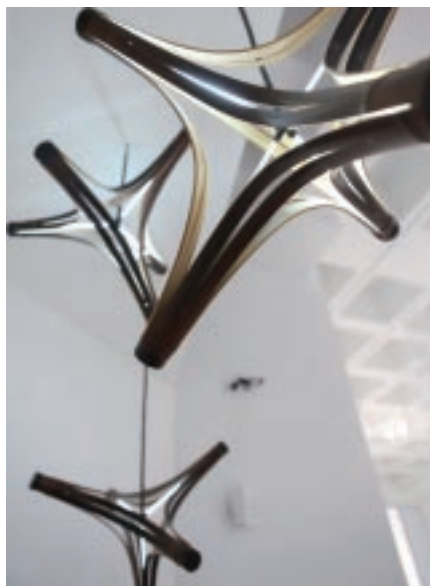
葉基祥、林桓民 爆竹 竹、玻璃、鋁、燈具組 56×66×50cm 2011

主題一「科技生活下的工藝時尚」：工藝不僅可與科技產生結合，更能夠進一步彼此影響轉化，透過不同的設計手法開拓出時下工藝品的豐富樣貌。〈洛可可－廢鐵〉零件取材你我再熟悉不過