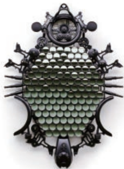
江承堯、王俊隆 洛可可計畫－廢鐵機車零件 270×200×20cm 2011貝組 56×66×50cm 2011

主題三「科技提升工藝技術」：傳統工藝品受限於手工製造，生產數量及品質難以掌控，科技的複製方法則為工藝產業帶來了衝擊與創作路線的新指引。快速成型機器就好比3D列印機，將新設計一個一個「印出立體造型」來，顛覆了工藝品難以複製的特性，並可控制製作品質；運用成熟的奈米技術，能使竹材有較佳的抗菌、防霉、防裂能力，品質升級更環保；超音波機器則縮減了藍染製程時間與人工成本，使製作過程效益提升。