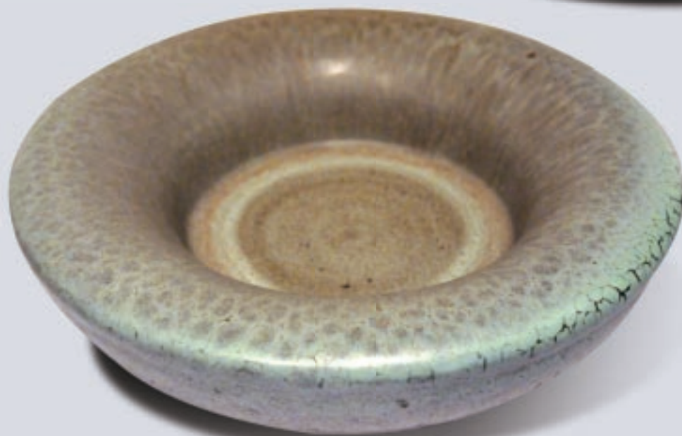
← 蔡榮祐 憨厚(二) 33.6×33.6×10.1cm 2009