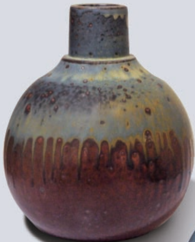
← 蔡榮祐 釉彩37 19.7×19.7×23.4cm 2008