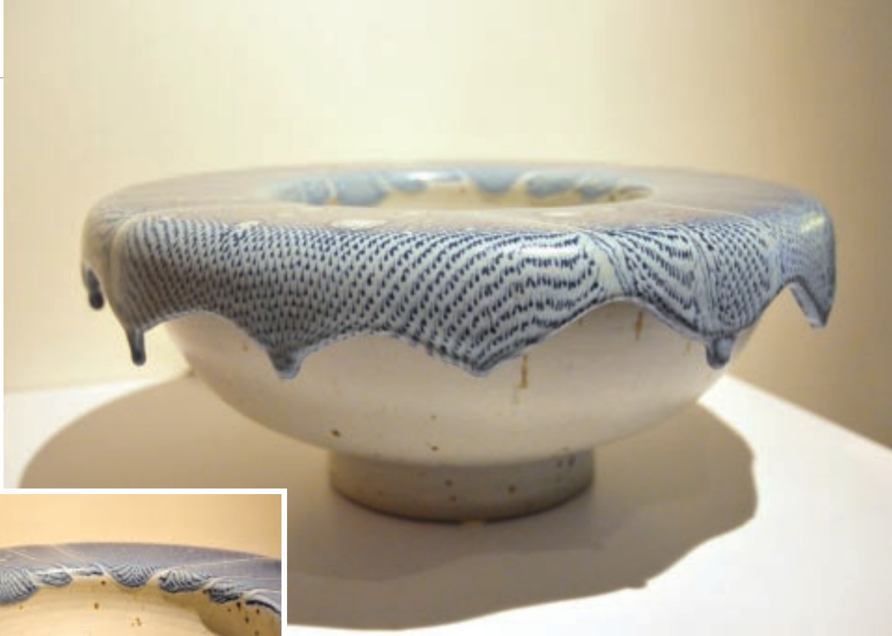
蔡榮祐 包容（六） 37×37×15.6cm 2009