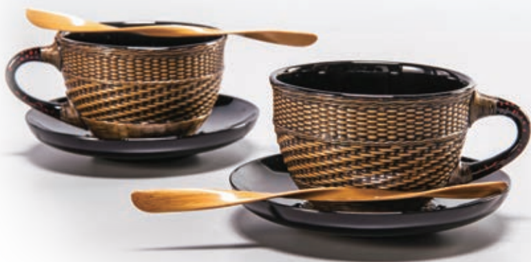
林港平 分享 戶外野餐容器、食器 2019 竹篾（桂竹）、天然漆、色粉、金箔、漿糊、 棉布、黃土粉、臺灣孟宗竹 37×36×47cm

林港平的竹編手藝最先向同鄉的資深竹藝師林根在學習，後來又再向邱錦緞學習劈竹篾工法，對於竹子的優缺點與特性掌握得透徹。他指出：「竹子是環保材，平均四年就可砍伐採收，取之不盡，值得好好利用。我喜歡手作的器物，但是花費心思做出來的竹器用途卻有限，而最嚴重的問題就是在臺灣的氣候溼度下容易發霉。」為此，他尋向廖勝文學習漆藝，在他兼職創作的有限時間裡，積極沉浸在工藝的世界裡研究、磨練，以籃胎漆器的技法克服這個問題。舉杯子為例，竹編杯體（籃胎）的內外以天然漆髹塗處理成漆器，杯內平整耐酸鹼、高溫，杯外仍能見竹編精緻的手作紋路。把手以漆變塗技法裝飾，以漆加麵粉與杯黏合，再以竹釘穩定結構，繞竹藤加強，提昇了整體的機能。林港平運用臺灣原生材料，打造出生活中的工藝之美。