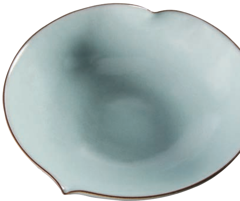
林冠宏 天青桃盤 器皿 2019 臺灣陶土、日本瓷土、天青釉 36×36×11cm

林冠宏指出：「青瓷的表現有很大的文化包袱。」這幾年來一直試圖從青瓷釉燒中找到屬於現代的美感，終在頻繁往返故宮流連南宋官窯的賞析中，見到了線條亙古的美感；並且認知到「線條」正是現代人崇尚簡約設計的重要元素之一。因此在他的作品中看似平凡無奇的侈口稜線，一進一出之間都是在土坯上精心計算、標記過後的完美轉身。這件〈天青桃盤〉薄胎厚釉，底足露胎，1280度還原燒成；侈口處特別以刮釉方式，在視覺水平上活脫地畫出了線條重點，細而綿長，舉重若輕。