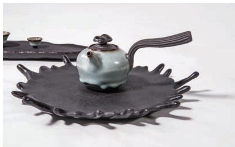
陳志強 潑墨粉青 茶席 2019 陶瓷 150×60×30cm