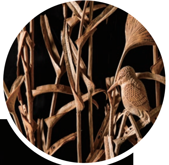
施惠閔 秋景圖蘆葦 竹雕擺飾 2020 孟宗竹、臺灣檜木、越南福建柏 80×30×120cm

施惠閔指出：「比起木材，竹這項材質更具限制性。」而為貼切表現秋色與蘆葦的輕盈，他在長達一年多的時間裡，收集不同口徑、甚至扁平形狀的孟宗竹來創作，以木雕的圓柱體雕刻技法造出翠鳥，透雕刻畫葉片蝕洞，或是以0.6公分的小電鑽規律鑽孔到幾乎打爛竹片，形成蓬鬆輕透的蘆葦花穗。材質的揀選與經驗技法的搭配，在時間沉澱的加乘下，造就極致的工藝美學。