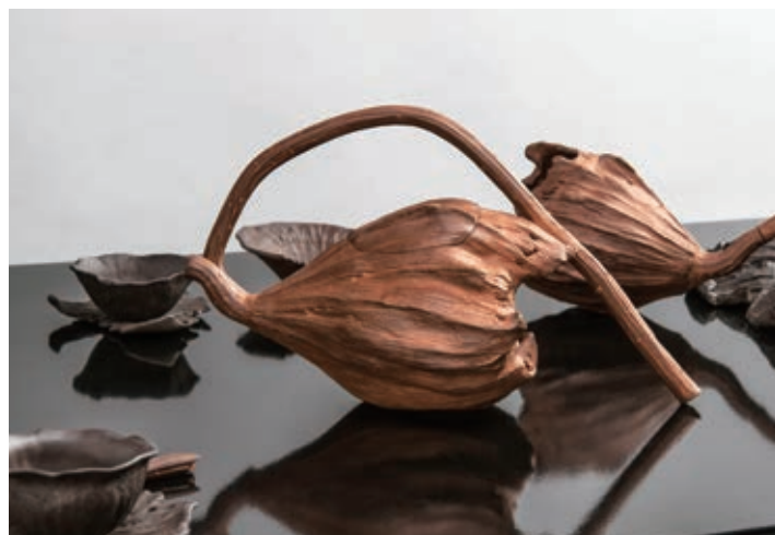
林智斌 禪荷。漱泉 茶席 陶瓷 2020 147×66.5×43cm