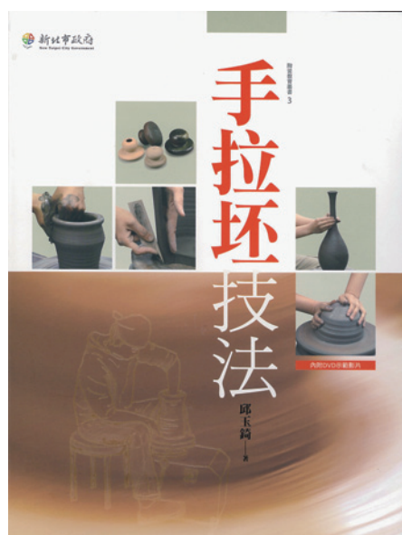
12 《手拉坯技法》手稿（邱玉琦提供）