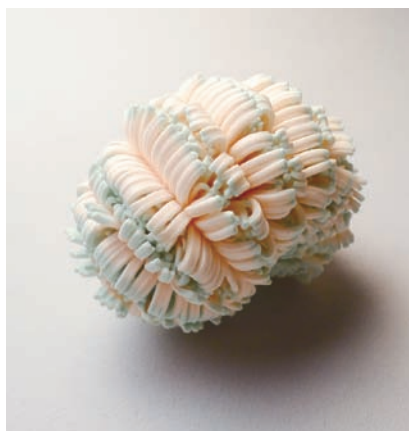
陳映秀 寫生系列—海葵和軟珊瑚III 2012 黃銅鍍白K、沐浴巾、超輕土 9.5×6.5×7.5cm