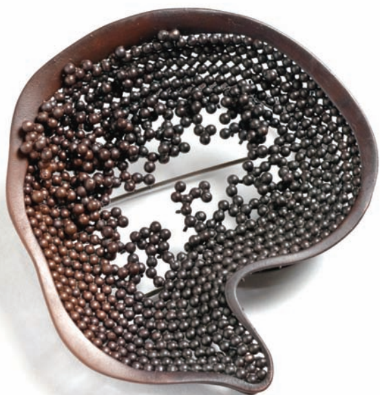
陳映秀 凝視I 2011 黃銅、現成物、不鏽鋼線 7×6.3×2.3 cm