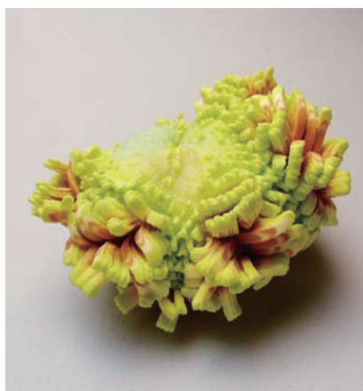
陳映秀 寫生系列—海葵和軟珊瑚IV 2012 黃銅鍍18K、沐浴巾、超輕土 8.3×8×5cm

以大量圓珠針所創作之「凝視」系列作品，金屬點點附在流體形的金屬製輪廓線上，就像植物或岩石表面長出的微小生物。「我喜歡『點』的元素，感覺會增加作品的生物性，」她說，「物體表面上的點，像是生物寄生其上，有生命正在醞釀著、作用著的感覺。」