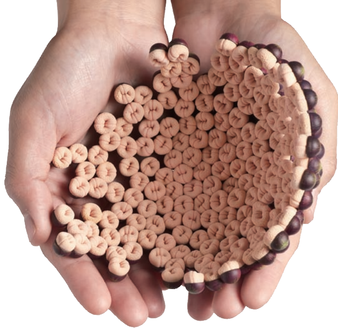
陳映秀 互利共生I配戴圖 2010 紅銅、現成物 13.5×12×7 cm