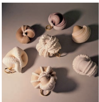
陳映秀 寫生系列－貝殼XXI-XXVII 2012 黃銅與不鏽鋼鍍22K金、絲襪、超輕土 7.5×6.5×5.5 cm (最大件)

在作品的形態上，陳映秀偏好柔軟、有機的視覺效果，即使是堅硬的金屬，也希望去除金屬的冰冷，賦與它曲線與肌理。