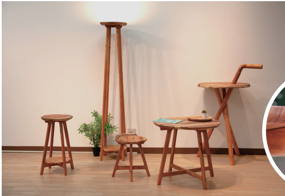
作品〈永恆的島〉使用臺灣杉木與桃花心木結合，豐富家具的色彩與質感。下圖為局部，以榫接技術連結所有的結構。