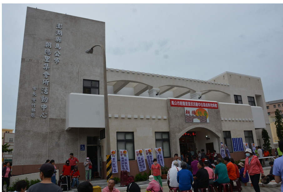
馬公市朝陽里集會所活動中心