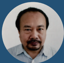
潘禮德 Rithy PANH

潘禮德 (Rithy PANH)，柬埔寨紀錄片導演、編劇。1964年生於金邊，1975年受赤柬壓迫而與家人一同下鄉進行勞動。在親眼見到因過度勞動或營養不良而死亡的親人後，經泰國而逃至法國定居，畢業於法國高級電影研究學院。