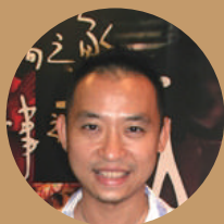
陳俊志 Mickey CHEN

陳俊志，紀錄片導演。台大外文系、紐約市立大學電影製作研究所。1996年開始拍攝紀錄片，同時是同志平權運動者，關注弱勢議題。曾任實踐大學媒體傳達系及工業設計系、紀錄片營隊講師。紀錄片多以同志議題為主，1999年作品《美麗少年》曾於國內商業映演創下新高票房，並受邀至日本東京大學、早稻田大學、帝國大學演講同志議題，更獲2002台北電影獎商業類年度特別獎、國外各影展放映之肯定。